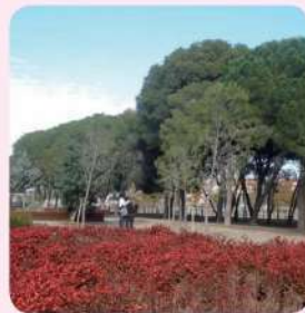
18 Parc del Pinaret