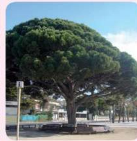
14 Pl Rodó