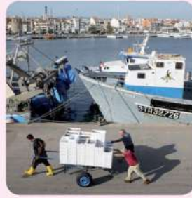
3 Pescadors feinejant