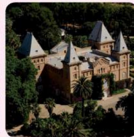
19 Parc Samà