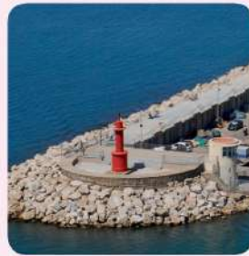
13 Far vermell