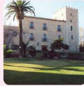
9 Castell de Vilafortuny