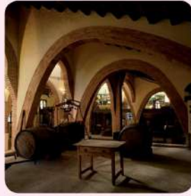
2 Museu Agrícola de Cambrils