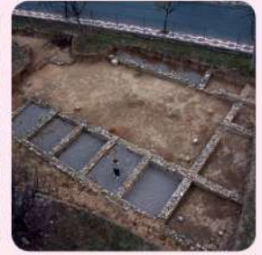
5 Vil·la romana de La Llosa