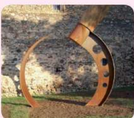
26 Estela falç