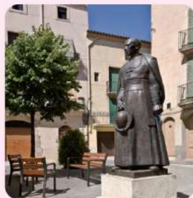
22 Cardenal Vidal i Barraquer