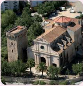
6 Torre i Ermita de la Mare de Déu del Camí