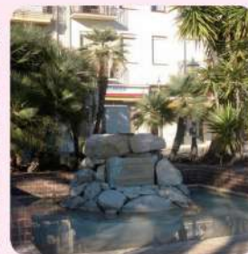
24 Plaça de Marcel·li Domingo