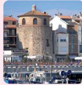
4 Torre del Port