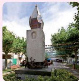
23 Monument Antoni Gimbernat i Arbós