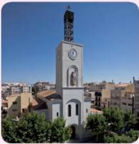
11 Església de Sant Pere