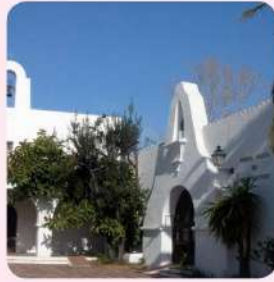
7 Església de la Mare de Déu de Vilafortuny