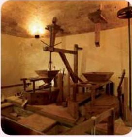
1 Museu Molí de les Tres Eres