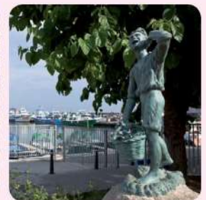
25 Nen pescador