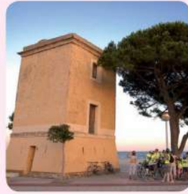
8 Torre del Telègraf