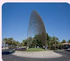
27 A tota Vela