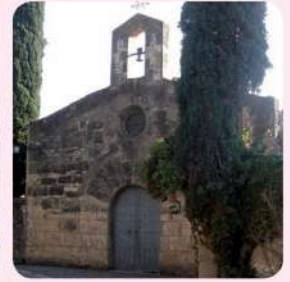
10 Església d'en Bosch