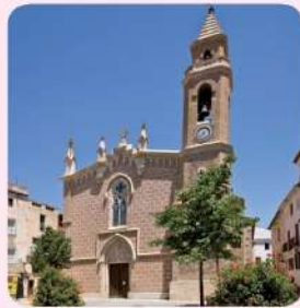
12 Església de Santa Maria