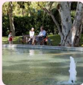
17 Parc del Pescador